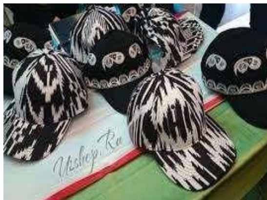
6-7-rasmlar. Qadimiy va zamonaviy erkak va ayollar bosh kiyimi bo'lgan do'ppi va do'ppi-kepka.

Buni biz hozirgi kunda amaliy bezak ko'inishiga aylanayotgan bosh kiyimlarimiz misolida ham ko'rishimiz mumkin. O'zbek erkaklarining or-nomusi, qadrini baland kerib yurishiga sabab bo'lgan, milliy do'ppilarimiz hozirgi davrga kelib, nafaqat o'zbek yigitlarining bosh kiyimi sifatida keng qo'llanilmoqda, balki moda sanoatida o'ziga hos bezak uslubini yaratib, zamonaviy bosh kiyimlari ko'inishida qayta tug'ilyapti.