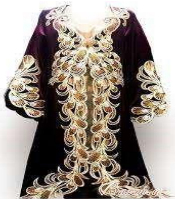
5-rasm. Binafsha rangli duxoba zodagon ayol libosi.

Ayollar kiyimining ranglariga ko‘ra, erlarning holatini ham baholash mumkin edi. Boy o‘zbeklar o‘z xotinlariga ko‘k yoki binafsha liboslar kiydirishgan, hunarmandlarning xotinlari esa yashil kiyimda yurishgan.