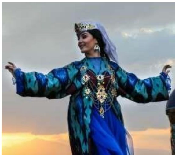
1-rasm. Milliy o‘zbek libosi

Xalq turmushining har qanday sohasi kabi o‘zbek milliy kiyimini o‘rganish o‘zbek xalqining etnik tarixi va madaniyatini, uning boshqa xalqlar bilan o‘zaro aloqalarini tadqiq etish bilan chambarchas bog‘liqdir. U moddiy va ma‘naviy yodgorliklar ichida xalqlarning milliy o‘ziga xosligini aks ettiruvchi va etnik belgilarini ko‘rsatuvchi mezondir. Kiyimlarda urfodatlar, ijtimoiy munosabatlar, mafkuraning ba‘zi bir elementlari, diniy e‘tiqod, nafosat va estetik normalar o‘z aksini topgan. Bundan tashqari, kiyimlarda inson yashagan joy va zamon, uning hayotidagi quvonchli yoxud qayg‘uli voqealar namoyon bo‘ladi.