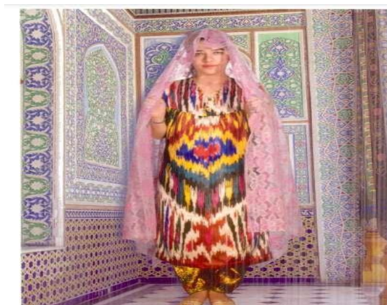
3-rasm. Milliy o‘zbek ayol kelinlari libosi

Ammo o‘zbek modasining asosiy xususiyati o‘zgarmas bo‘lib qolaveradi – asrlar davomida faqat sharqona go‘zallikka xos bo‘lgan jozibali tasvirlarni yaratib bergan ajoyib o‘zbek matolari, milliy zargarlik buyumlariga bo‘lgan sodiqlik.