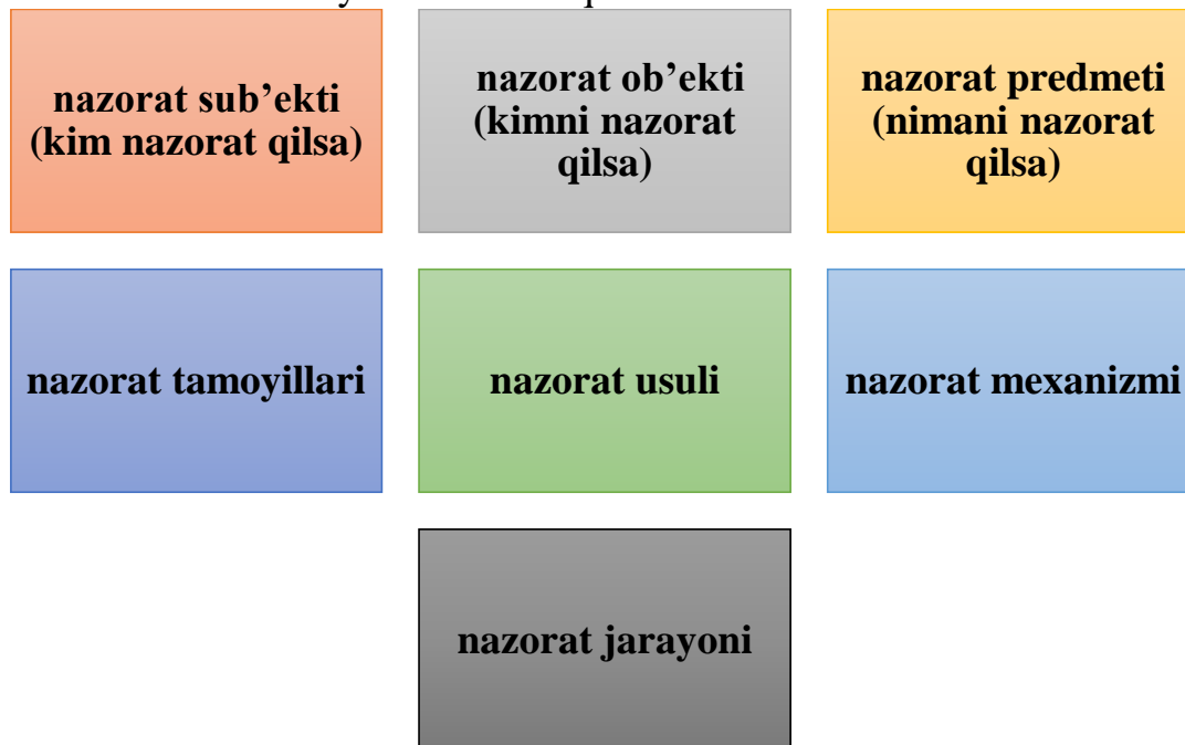
1-rasm. Davlat moliyaviy nazorati tizimi elementlari 1

Davlat nazorati tizimi yaxlit holatda qator elementlardan iborat: