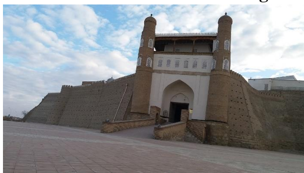
Buxoro davlat badiiy me‘morchilik muzeyi qo‘riqxonasi