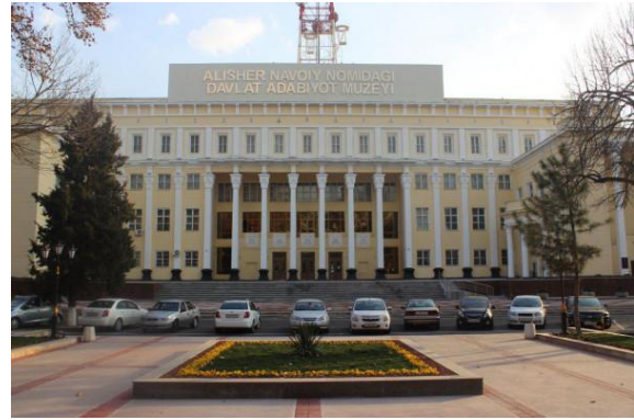
O'zbekiston Respublikasi Fanlar Akademiyasi Alisher Navoiy nomidagi davlat adabiyot muzeyi

2022-yil holatiga ko'ra yurtimizda 134 ta muzey (filiallarini qo'shgan holda) mavjud bo'lib, ulardagi eksponatlar soni 2 mln. 158 ming 4 yuzta, muzeylarda o'tkazilgan ekskursiyalar soni 105 ming 39 ta ta, muzeylarda tashkil etilgan ko'rgazmalar soni 1301 ta, muzeylarga tashriflar soni 5 mln. 673 ming 800 tani tashkil etadi.