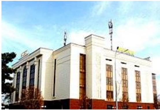
Samarqand davlat badiiy muzey qo'riqxonasi