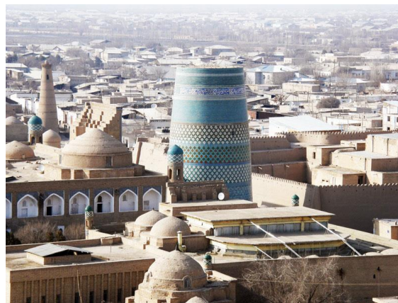
Xivadagi “Ichan-Qala” majmuasi