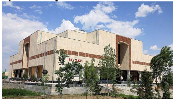
Qoraqalpog‘iston Respublikasi I.V. Savitskiy nomidagi davlat muzeyi