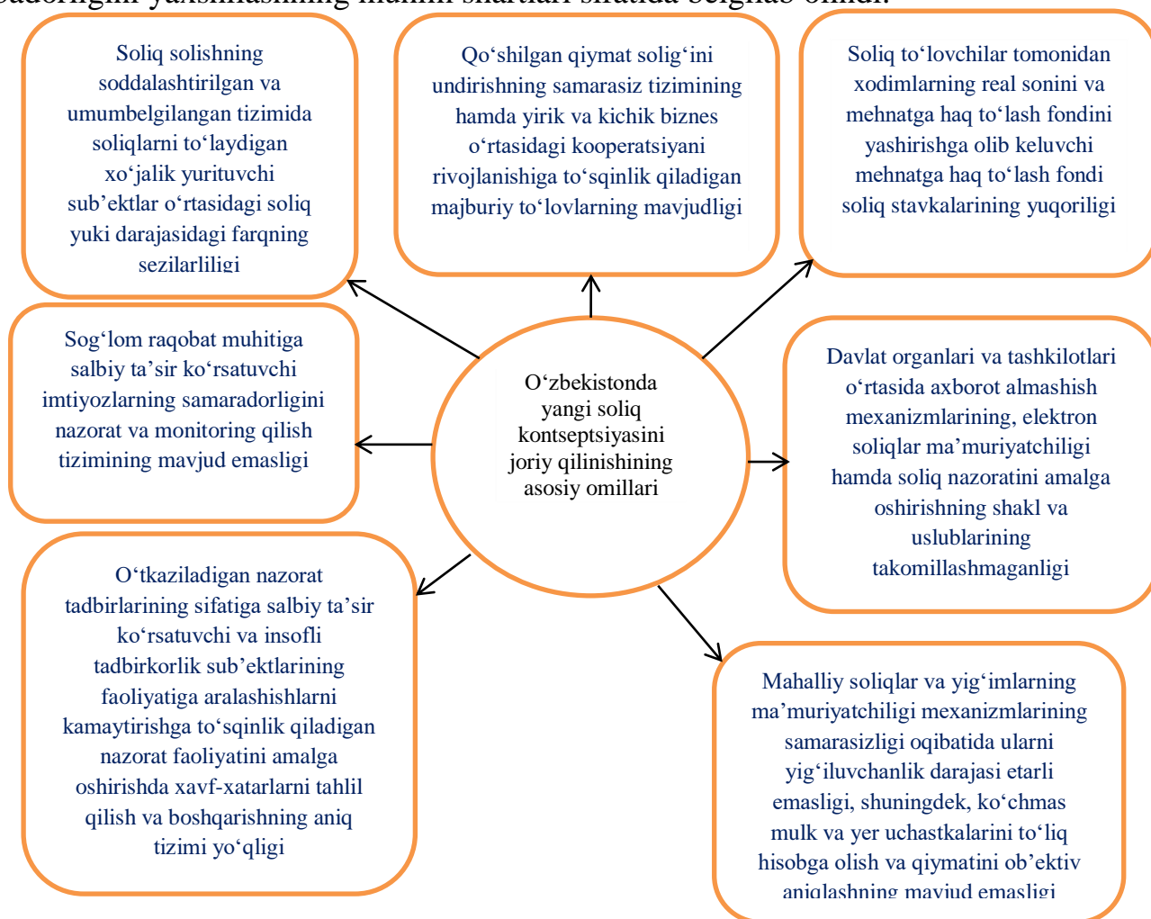
2-rasm. O‘zbekistonda yangi soliq kontseptsiasini joriy qilinishining asosiy omillari 2

O‘zbekiston Respublikasining hozirgi soliq siyosatining muhim xususiyati shundaki, unda strategiyaning aniq belgilanishi, unga erishishning taktik yo‘nalishlarining ifodasi sifatida ilmiy asoslangan kontseptsianing ishlab chiqilib, izchil amalga oshirilib borilayotganligidir. O‘zbekiston Respublikasini yanada rivojlantirish bo‘yicha Harakatlar strategiyasida O‘zbekistonning soliq siyosatining strategiyasi sifatida soliq yukini kamaytirish, soliqqa tortish tizimini soddalashtirish siyosatini davom ettirish soliq ma‘muriyatchiligini takomillashtirish va tegishli rag‘batlantiruvchi choralarni kengaytirish kabi muhim masalalar belgilab olingan bo‘lib, bular iqtisodiyotni tezkor rivojlantirish hamda mamlakatning investitsiyaviy jozibadorligini yaxshilashning muhim shartlari sifatida belgilab olindi.