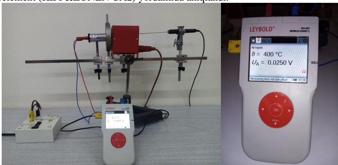
1-rasm. Tajriba qurilmasining ko'rinishi.

Mazkur tajribada “absolyut qora jism” sifatida LD Didactic GmbH elektr pechidan foydalaniladi (1-rasm). Absolyut qora jism detallari jilvirlangan mis silindr va ekrandan iborat. Bir uchi izolyatsiya qilingan mis silindr elektr pechga kiritiladi va talab qilingan temperaturagacha qizdiriladi. Zarur bo'lganda suv bilan sovutiladigan ekran elektr pechning oldiga shunday o'rnatilganki, yuqori haroratli pechning tashqi devorlarining nurlanishini emas, faqat jilvirlangan silindrning issiqlik nurlanishini o'lchash mumkin. NiCr-Ni temperatura datchigi mis silindrda temperaturani o'lchash uchun qo'llaniladi. Issiqlik nurlanishi natijasida hosil bo'lgan elektr kuchlanish Leybold Mobile-Cassy 2 raqamli universal o'lchov asbobiga ulangan termoelement (KIPP&ZONEN CA2) yordamida aniqlandi.